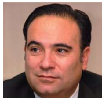
Ministerio de Industria, Comercio y Turismo Luis Guillermo Plata – Ministro Datos de contacto: info@mincomercio.gov.co Ocupa desde enero de 2007 la cartera del Ministerio de Industria, Comercio y Turismo, tras cuatro años al frente de la agencia de exportación Colombiana, Proexport. www.mincomercio.gov.co